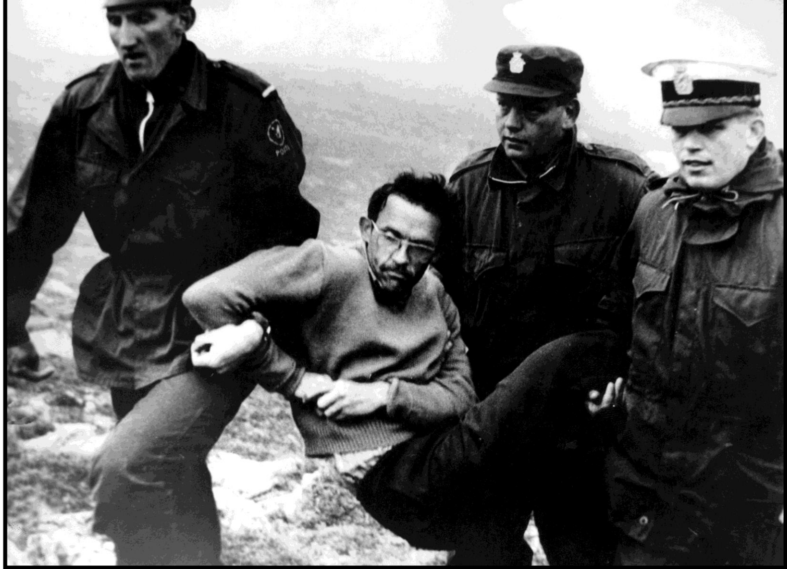
Kampen om Mardøla, 1970. Miljøfilosofen Sigmund Kvaløy Sætreng blir arrestert under landets første sivil ulydighetsaksjon.