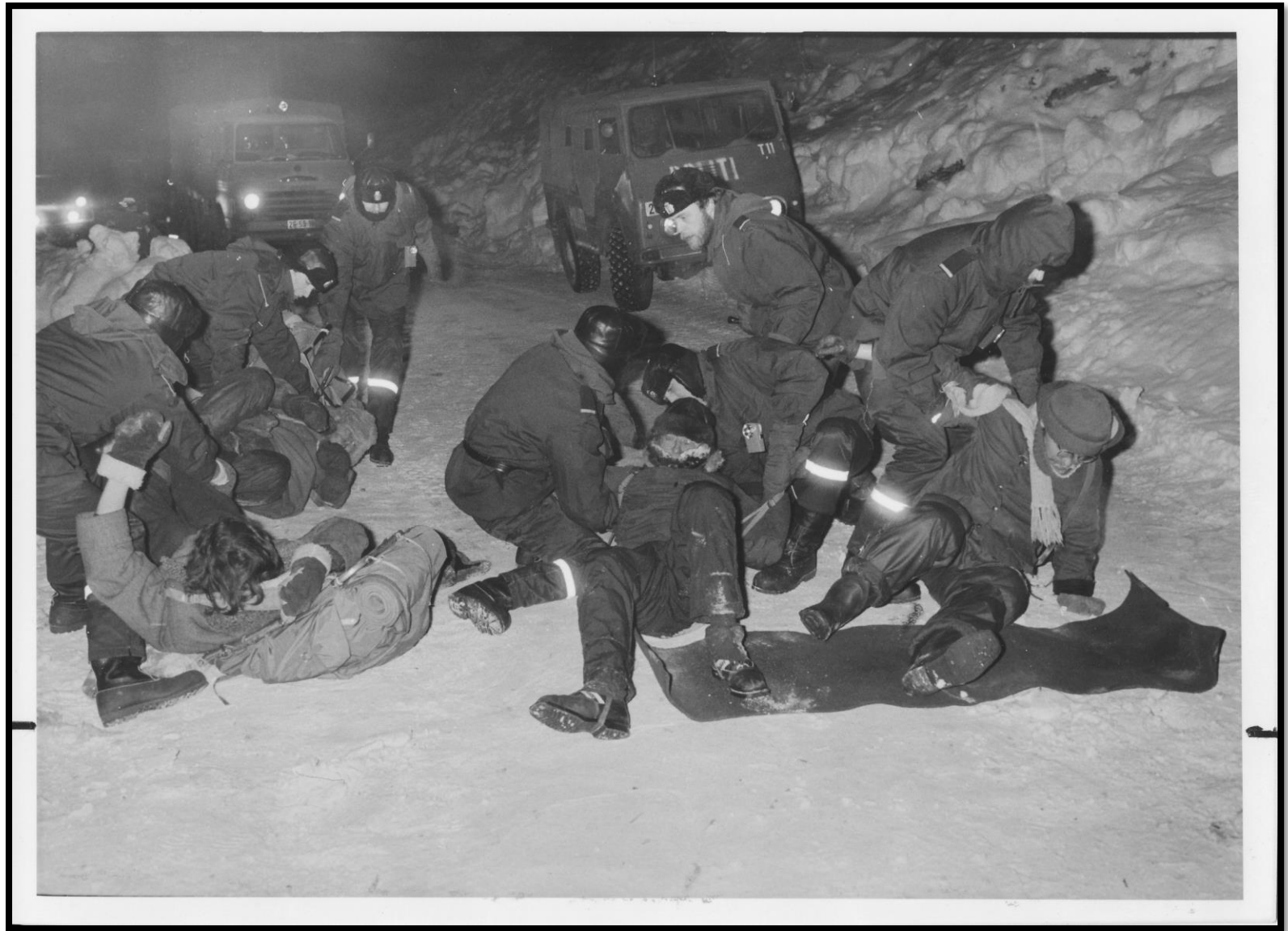
Slaget i Stilla, 14. januar 1981. Politiet kuttet lenker, bar aksjonister og fraktet dem bort, fra morgen til kveld. Cirka 800 ble arrestert.